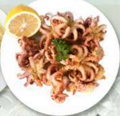
12,50€ PULPITO FRITO Pulpito fregit Fried baby octopus