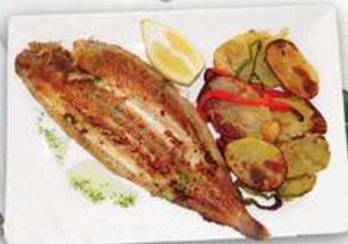
19,95€ LENGUADO A LA PLANCHA Lenguado a la planxa Grilled sole