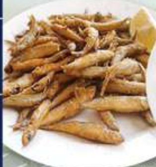
12,00€ PESCADITOS FRITOS Peixets fregits Fried fish