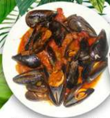
12,95€ MEJILLONES MARINERA Musclos a la marinera Mussels fisherman style