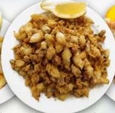
12,50€ PUNTILLAS Calamarcets fregits Fried baby squid