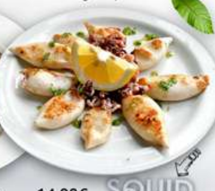
14,00€ SQUID CHIPIRONES A LA PLANCHA Calamarçets a la planxa Grilled baby squid