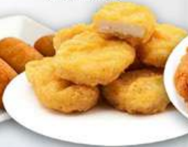
7,95€ NUGGETS DE POLLO Nuggets de pollastre Chicken nuggets