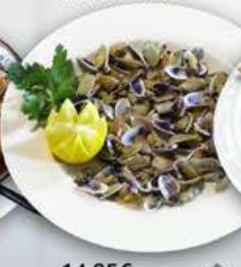
14,95€ TELLINAS Tellines