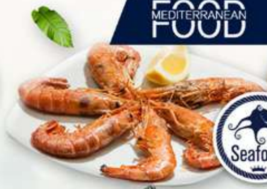
GAMBAS A LA PLANCHA Gambes a la planxa Grilled prawns 16,00€