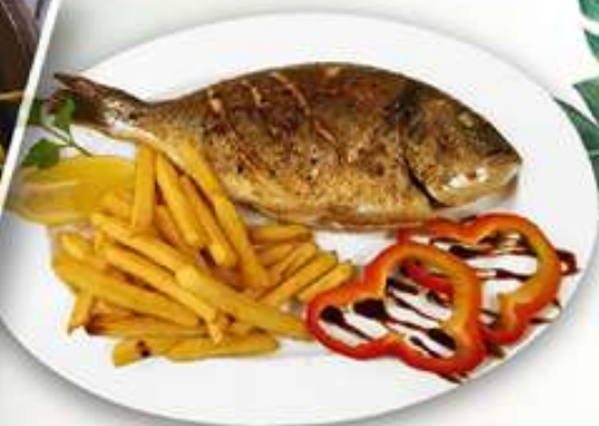
17,50€ DORADA A LA PLANCHA Orada a la planxa Grilled bream