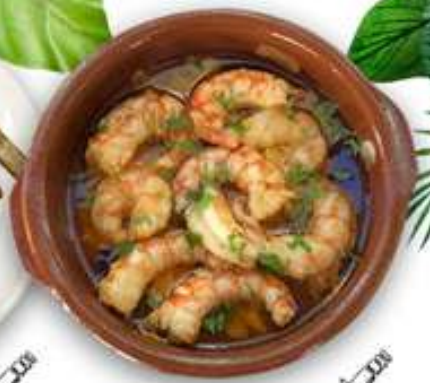
14,95€ GAMBAS PELADAS AL AJILLO Gambes pelades amb allis Peeled garlic prawns