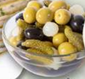
3,95€ OLIVAS COCKTAIL Olives cocktail Cocktail olives