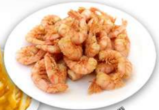
12,00€ GAMBITAS FRITAS Gambetes fregides Fried prawn