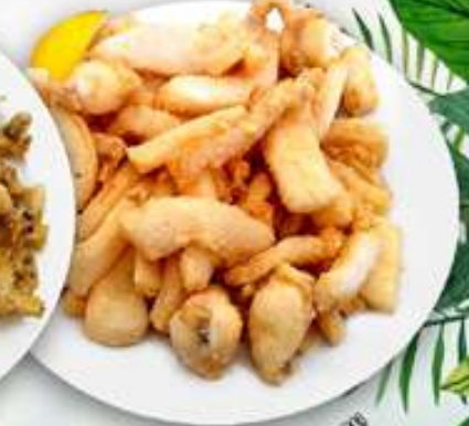
12,00€ CHOCOS Sèpia Cuttlefish