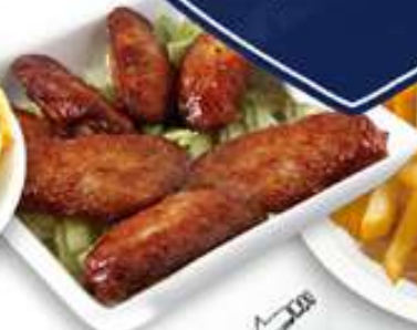
9,50€ ALITAS DE POLLO Aletes de pollastre Chicken wings