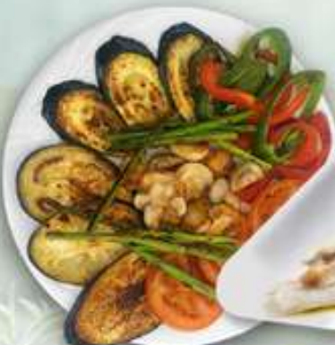
14,95€ VERDURAS A LA PLANCHA Verdures a la planxa Grilled vegetables