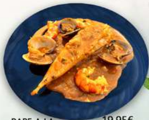
19,95€ RAPE A LA MARINERA Rap a la marinera Monkfish a la mariniera