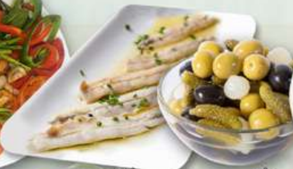
10,00€ BOQUERONES EN VINAGRE Seitons en vinagre Anchovies in vinegar