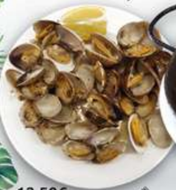
12,50€ ALMEJAS AL VAPOR Cloïsses al vapor Steamed clams