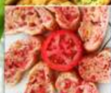
3,50€ PAN CON TOMATE Pa amb tomàquet Bread with tomato