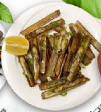
12,95€ NAVAJAS A LA PLANCHA Navalles a la planxa Grilled razorfish