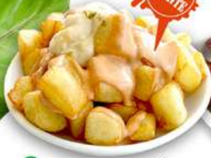
7,50€ PATATAS BRAVAS Patates braves Potatoes in spicy sauce