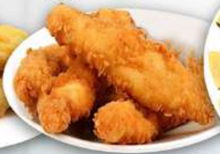
11,00€ DEDOS DE POLLO Dits de pollastre Chicken fingers