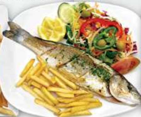
17,00€ LUBINA A LA PLANCHA Llobarro a la planxa Grilled sea bass