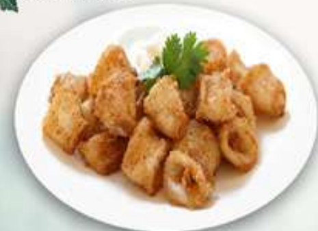
SEVILLANOS Calamars a la sevillana Squid "Seville style" 12,95€