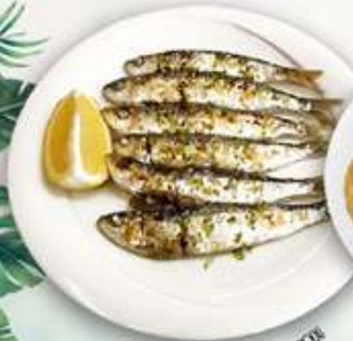
12,00€ SARDINAS PLANCHA Sardines a la planxa Grilled sardines