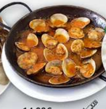
14,00€ ALMEJAS MARINERA Cloïsses a la marinera Palourdes à la mariniera