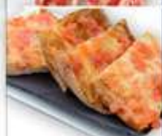
5,95€ PAN DE CRISTAL Pa de vidre Crystal bread