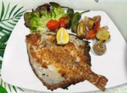
23,95€ RODABALLO A LA PLANCHA Turbot a la planxa Grilled turbot