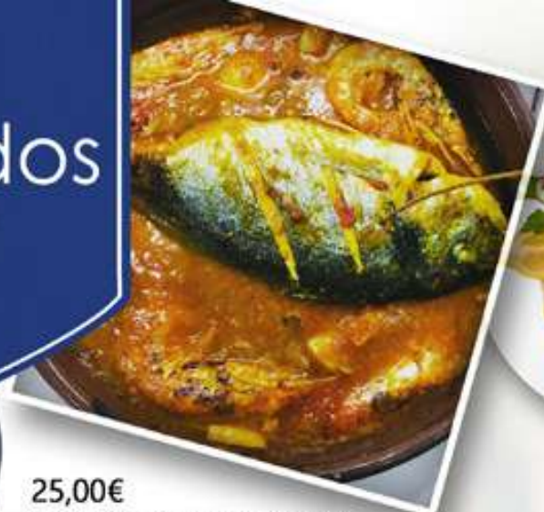
25,00€ DORADA AL HORNO CON GAMBAS Orada al forn amb gambes Oven-baked sea bream with prawns