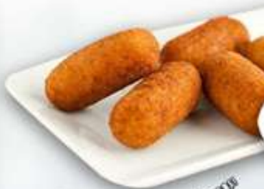
9,00€ CROQUETAS DE COCIDO (POLLO) Croquetes (Pollastre) Cooked croquettes (Chicken)