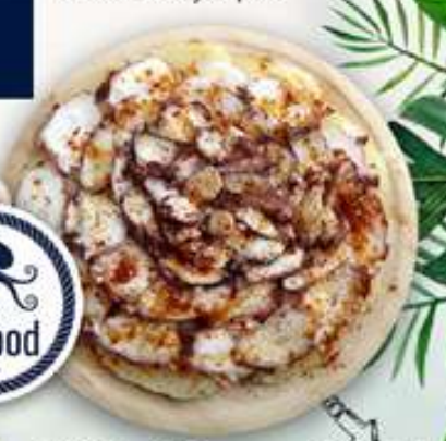
PULPO A LA GALLEGA Pop a la gallega Fish octopus "Gallega" 22,95€