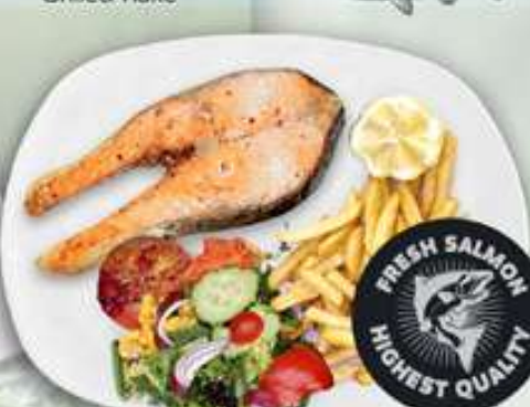
19,95€ SALMÓN FRESCO A LA PLANCHA Salmó fresc a la planxa Grilled salmon