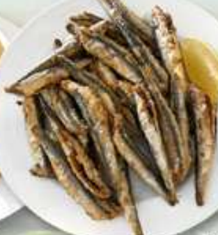
12,95€ BOQUERONES FRITOS Seitons fregits Fried anchovies