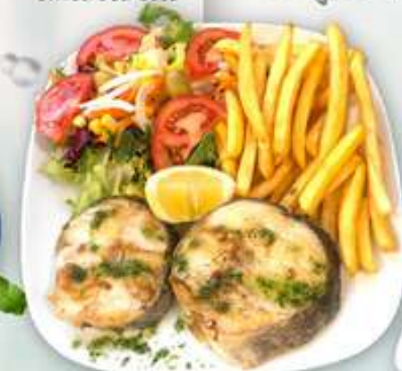
15,50€ MERLUZA A LA PLANCHA Lluc a la planxa Grilled hake