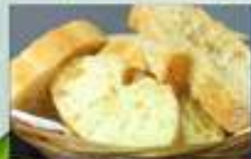
2,50€ PAN Pa Bread