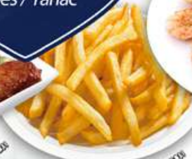
4,00€ PATATAS FRITAS Patates fregides Chips