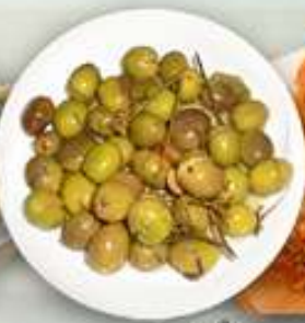
3,95€ ACEITUNAS RELLENAS Olives farcides Stuffed olives