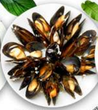
11,00€ MEJILLONES AL VAPOR Musclos al vapor Steamed mussels