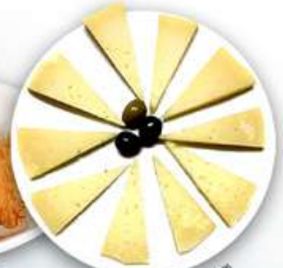
11,00€ PLATO DE QUESO MANCHEGO Plat de formatge manxec Manchego cheese plate