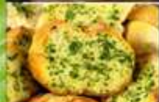
4,00€ PAN DE AJO Pa d'all Garlic bread