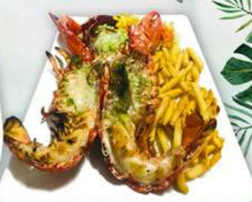
BOGAVANTE A LA PLANCHA Llambantol a la planxa Grilled Lobster