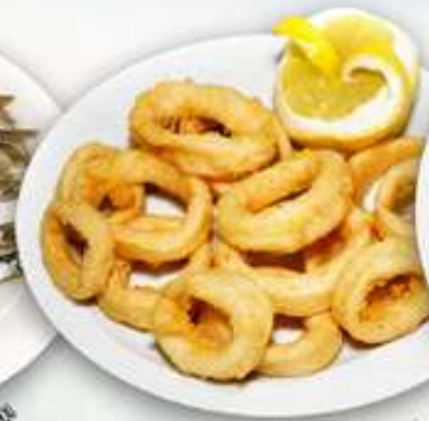
14,50€ CALAMARES A LA ANDALUZA Calamars a l'andalusa Squids at "Andaluza" style