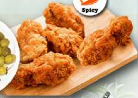
10,00€ ALITAS DE POLLO PICANTES Aletes de pollastre picants Spicy Chicken Wings